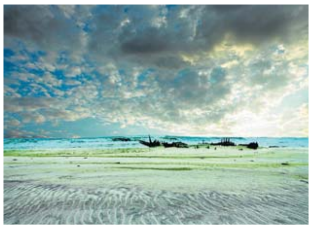
Una de les platges solitàries i remotes del continent africà.

El filòsof mexicà Leonardo da Jandra (Chiapas, 1951) no va voler escriure una ficció sobre les illes desertes, sinó experimentar-ho ell mateix, i va marxar, juntament amb la seva companya, a Huatulco, un paratge paradisiac de la costa mexicana d'Oaxaca. Com els protagonistes de Tufail o Defoe, hi van sobreviure, des del 1979, de la caça i la pesca, observant l'entorn selvàtic i reflexionant durant gairebé un quart de segle. I d'allà va sorgir, també, un pensament filosòfic original allunyat dels tòpics i d'una idea romàntica de la natura, que reivindica la necessitat social de l'individu com a primer pas per sortir de l'egocentrisme. En el seu últim llibre, Filosofia para desencantados (Atalanta, 2014), ho diu taxativament: "Sempre em violentava quan algú, per identificar el meu aïllament a la selva, em deia rous-