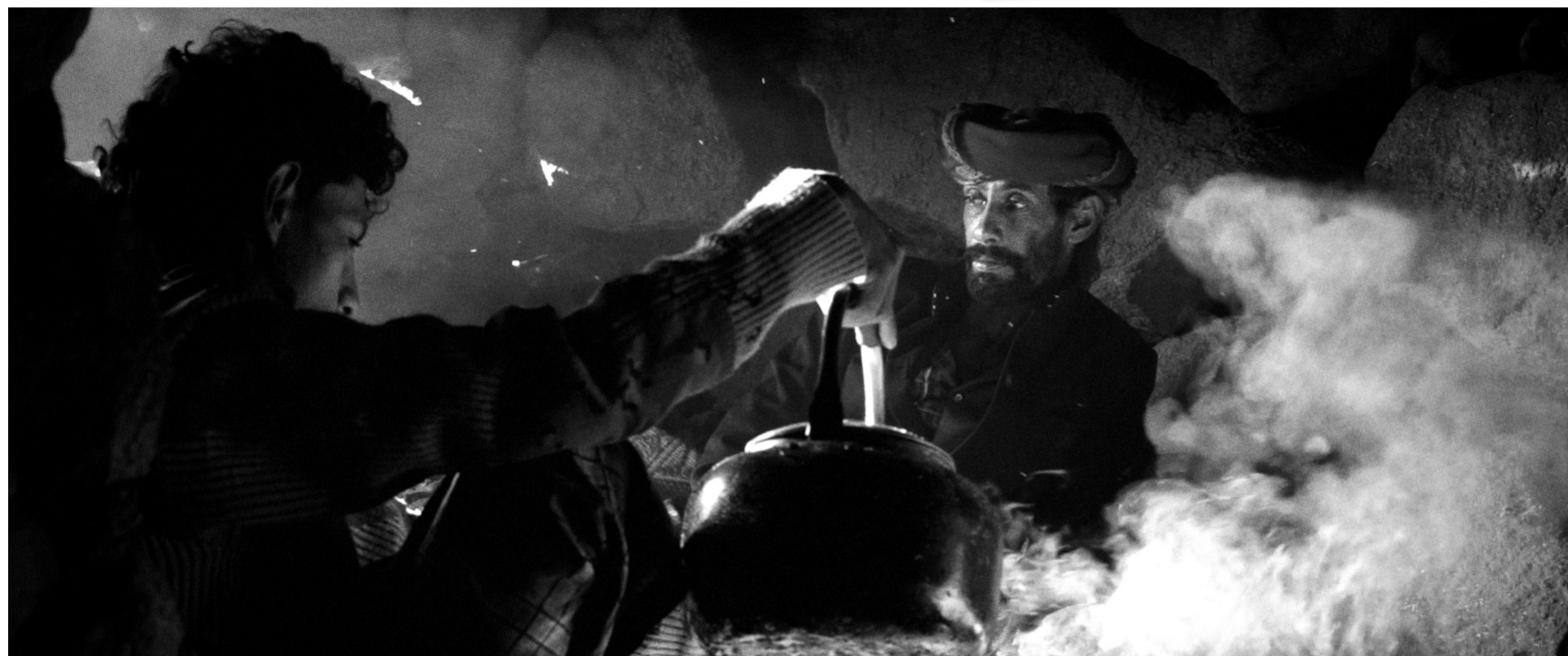
Una de les preciosistes imatges en blanc i negre incloses al llibre-catàleg 'Socotra' (editorial Atalanta) de Jordi Esteva. JORDI ESTEVA

Rudolf Otto (1869-1937) va examinar en aquest llibre, reeditat ara per Alianza, la categoria del sant, nascuda en l'esfera religiosa i traslladada després a l'ètica.