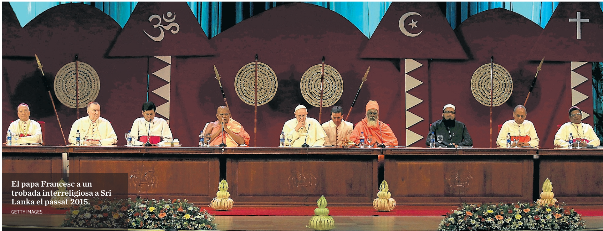
El papa Francesc a un trobada interreligiosa a Sri Lanka el passat 2015.

DEL DOCTOR IL-LUMINAT AL FOSC Per a Rosa Planas, Lull i Faust segueixen un mateix objectiu : el coneixement. Dos models de savi que representen dues actituds.