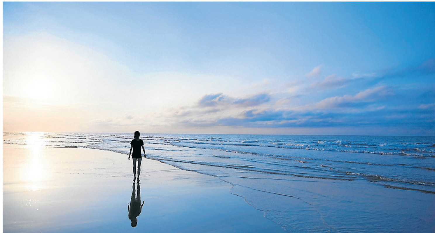
El protagonista de l'obra d'H.D. Lawrence ressuscita d'una manera propera i universal, on estem convidats.