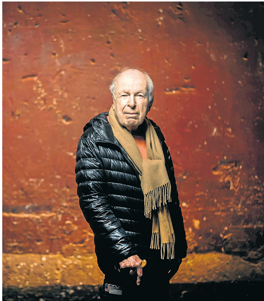
El dramaturg Peter Brook en un retrat fet fa dos anys.

Brook, nascut a Londres el 1925 de pares russos que van fugir a París el 1907 i, finalment, es van establir a Londres al començar la Primera Guerra Mundial (el cognom familiar és Bryk, però la y russa té el so d'u i a França es va convertir en Brouck, i a la frontera britànica l'oficial de passaports ho va adaptar a la pronunciació anglesa i ho va deixar en Brook), està considerat un dels millors dramaturgs del segle XX i, sens dubte, un dels grans renovadors del teatre contemporani. Ara, i arran de rebre el premi Princesa d'Astúries de les Arts 2019, l'editorial Siruela reedita Hilos de tiempo , la meravella