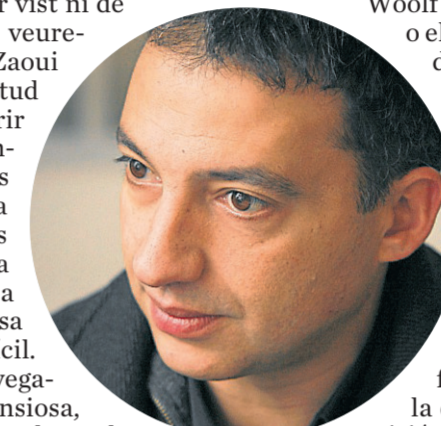
El filòsof francès, Pierre Zaoui.

Art que s'aprenen només de forma vivencial, on la teoria ens serveix per orientar-nos sense caure en falses discrecions, sense hipocresia, sense orgull, fruit d'un procés pacient -i també discret- que saneja. ■