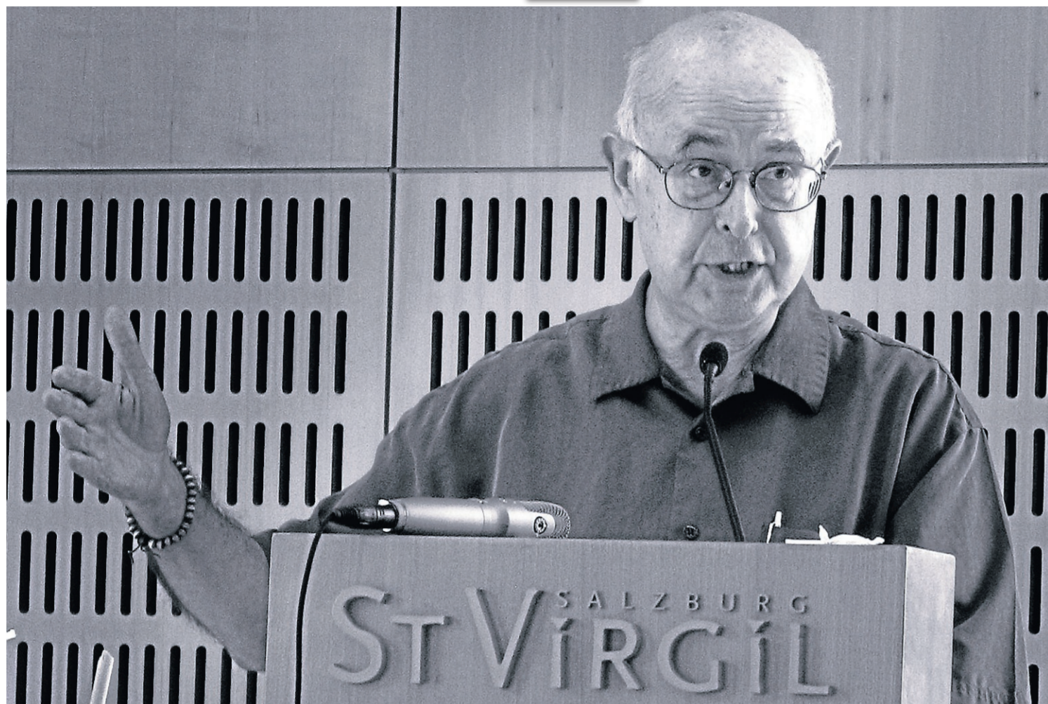
Paul F. Knitter, conegut teòleg cristià, en una imatge d'arxiu.

Per emprendre el camí de sincerar-se amb ell mateix, aquest cristià de cor va voler endur-se una llanterna complexa, que intuïa eficaç: el budisme. Al seu llibre titulat explícitament Sin Buda no podria ser cristià (Fragmenta) explica aquesta vivència i les seves conclusions d'un trajecte apassionat i vital: "En la